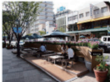
KOBE パークレットの取り組み