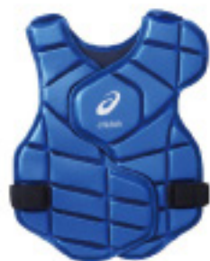
ジュニア用軟式プロテクター BPP570

工業製品のイメージが強いグッドデザイン賞ですが、開場が当館であり、神戸コレクションなど服飾産業と結びつきが強い都市であることから、服や靴などの「装身具」も選ばれています。機能的な素材を使用したものや、生活様式の変化が表れた受賞対象を展示します。(約10点)