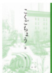
関西ノート B5 学習帳