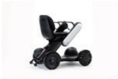
WHILL Model C

1キーワードは「様々な人が暮らしやすい都市」。近年の受賞対象の中から、神戸のクリエイティブ関係者が選んだ製品やサービスを、テーマ毎に展示します。(約30点)