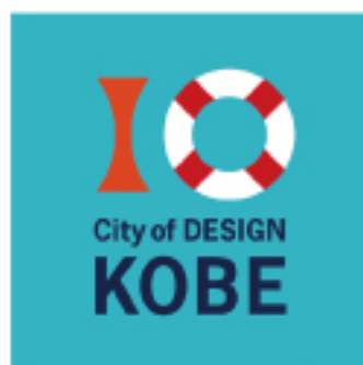
「GOOD DESIGN AWARD 神戸展」ロゴマーク