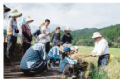
フードハブ・プロジェクト