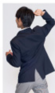
ストレスフリーアクティブ 学生制服