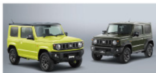
ジムニー/ジムニーシエラ

1,000件を超える年間受賞対象の中でも特に高評価を得たものが「グッドデザイン・ベスト100」として選出されます。今年度選ばれた「暮らしの未来」を更新する先進的なデザインが並びます。(約100点)