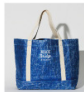
ブルーシードバッグ