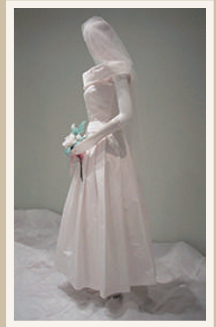
《ウェディング・ドレス アニエスパー》 1998年