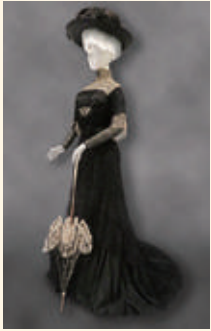
アフタヌーン・ドレス 1908年頃

「フランス文学が誘う街とファッション —19世紀後期から20世紀へ—」(II期)