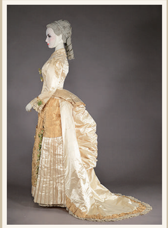
《ウェディング・ドレス》 1873年～75年頃