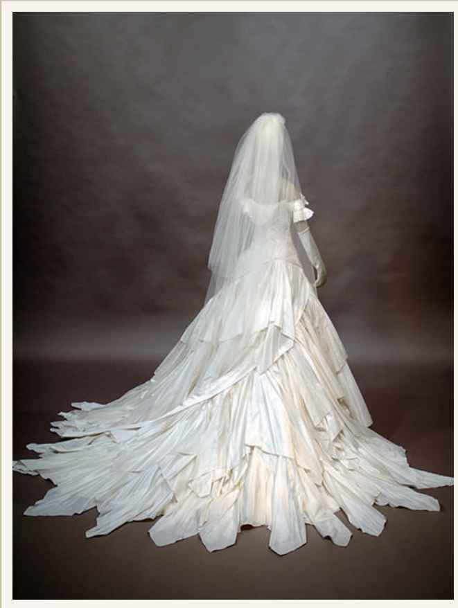
《ウェディング・ドレス ジョン・ガリアーノ／クリスチャン・ディオール》 2002年