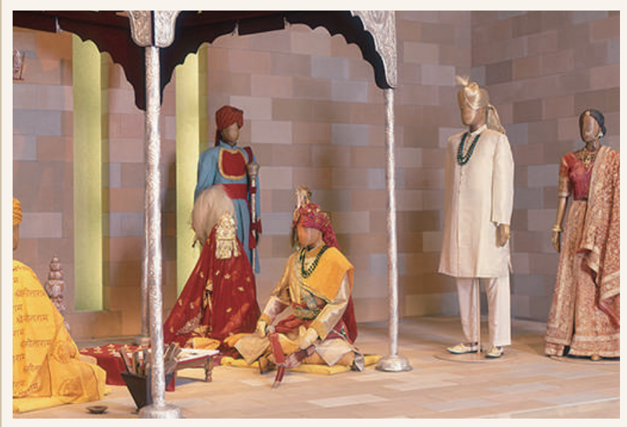
《マハラジャの婚礼》 1970年頃