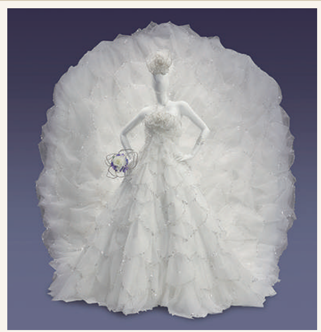
作品名：ローズユミ／デザイン：ユミカツラ