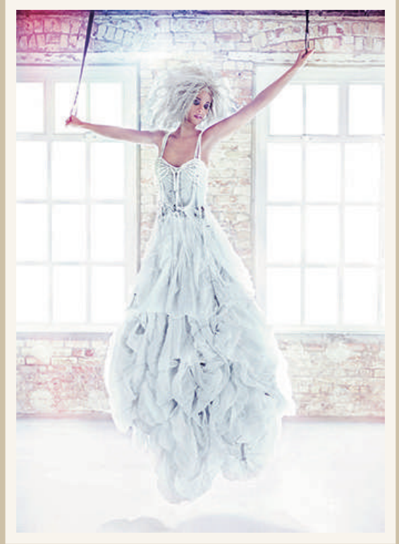
作品名：パラシュート ドレス／デザイン：ミチコシノ