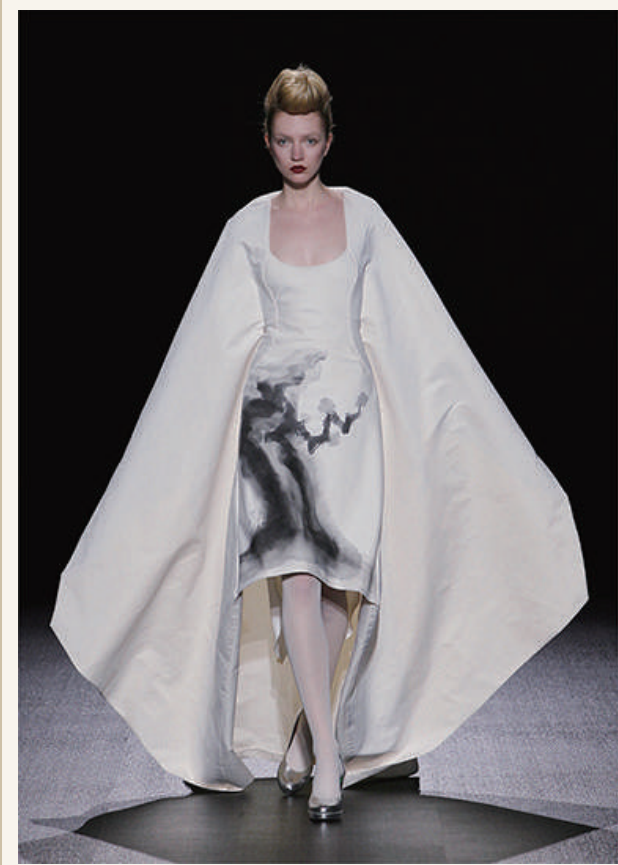
作品名：2011年秋冬コレクション／デザイン：コシノヒロコ