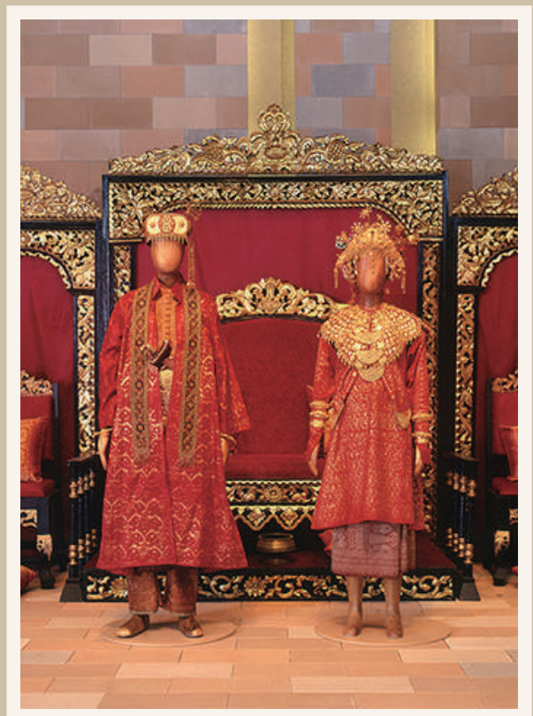
《インドネシア パレンバンの婚礼衣装》 20世紀