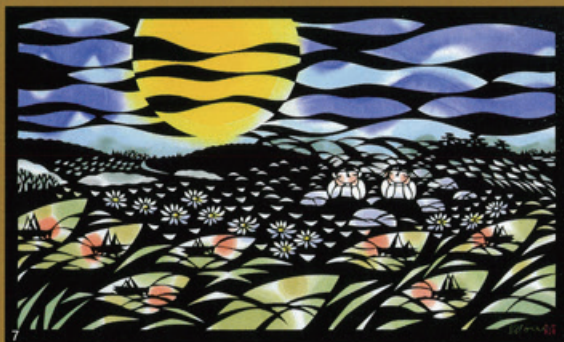
1. (team BLUE)2019年/松原真紀 2. (Sea Star)2021年/蒼山日菜 3. (無題)2019年/筑紫ゆうな 4. (LIFE-SIZED「surprise(驚き)」)2013年/福井利佐 5. (Robin)2017年/SouMa 6. (昂然(孔雀))2019年/切り剣Masayo 7. (満月だよ「真」より)2016年/柳沢京子