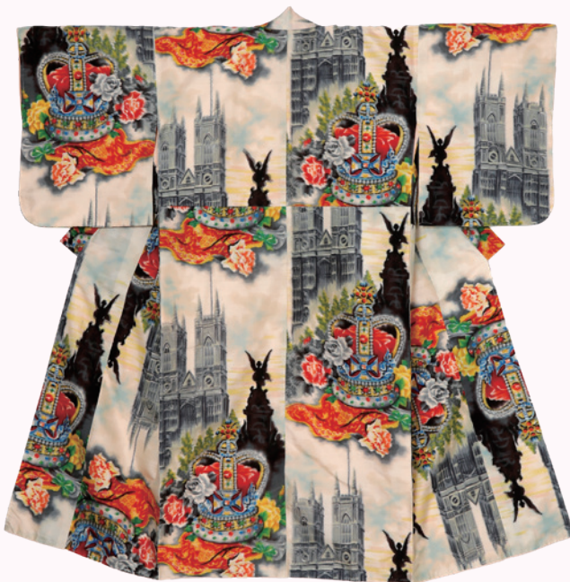
⑦ エリザベス女王戴冠式文様 (四つ身)