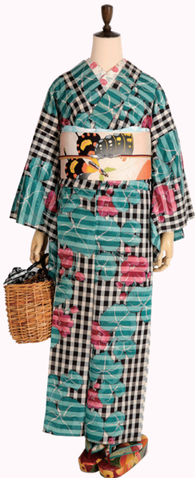
③格子にプリムラ文様（単衣）