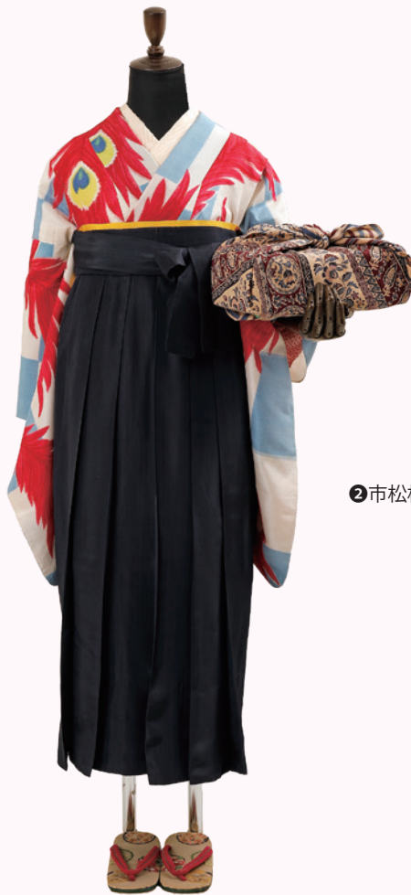
②市松格子に孔雀羽文様（単衣）+女袴