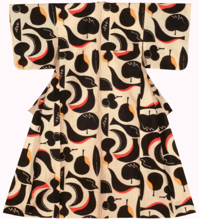
⑥ フルーツ尽くし文様 (単衣)