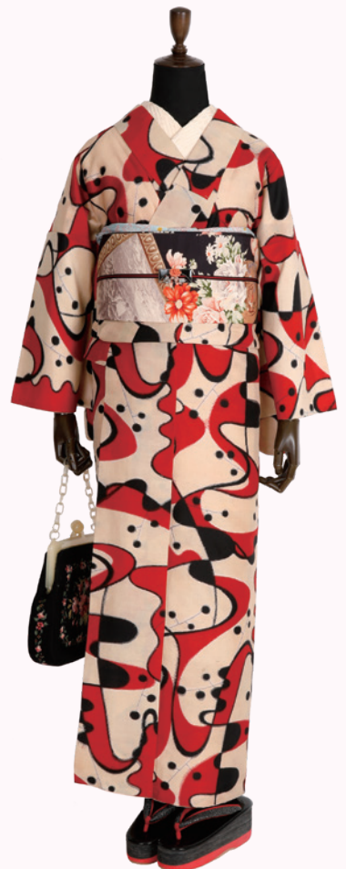
④白地に赤黒幾何学文様