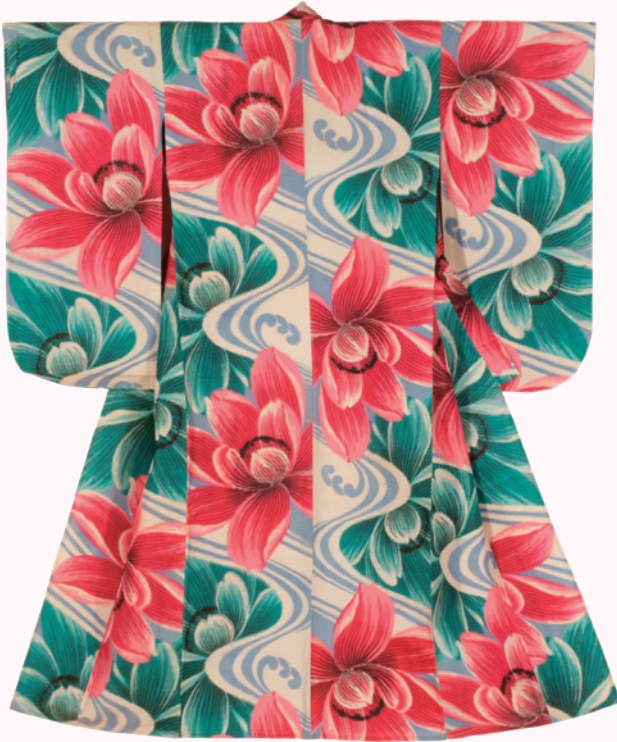
⑤ 流水に睡蓮文様 (単衣)