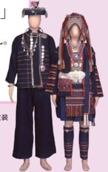
画像：タイ アカ族の伝統衣装

世界各地の風土や宗教が育んだ様々な儀礼。 華やかな特別な日の衣装や文化を 収蔵品から紹介します。