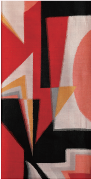
⑧ロシア・アバンギャルド風文様（部分）