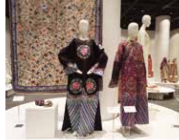
展示風景：中国の衣装

当館の所蔵品から、「シルクロード」によって栄えた各地域における20世紀のファッションとともに、絹を素材とする18世紀以降の西洋のドレスをご紹介します。東西の交流で、隣り合う国々や地域が影響を受けつつ発展した絹のファッションの歴史を想像しながらお楽しみください。