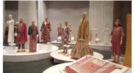
展示風景：ブータン、中央アジアとインドの衣装