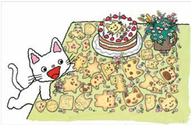
『ノントンたんじょうび』 © キヨノサチコ/備成社