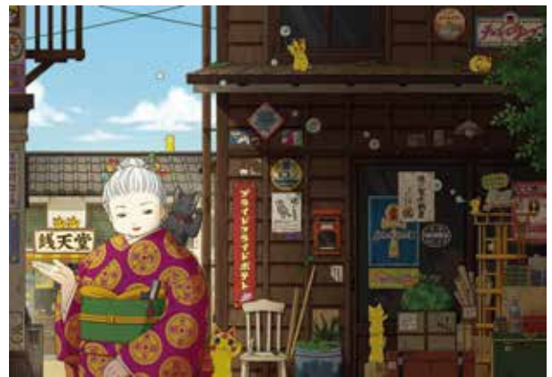
『ふしぎ駄菓子屋 銭天堂』シリーズ © 廣嶋玲子, jyajya / 偕成社