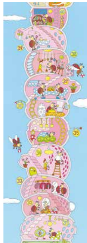
『100 かいたてのいえ』シリーズ © いわいとしお